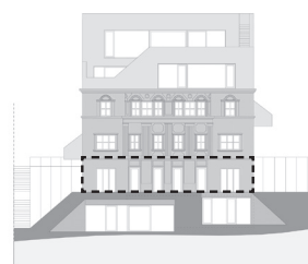
POHLED ZE ZAHRADY

Podlahová plocha bytu je včetně ploch příček a vnitřních nosných stěn dle vládního nařízení vlády č. 366/2013 Sb. Zobrazené vybavení nábytkem není součástí dodávky, toto vybavení je pouze grafickým znázorněním možného zařízení bytu.