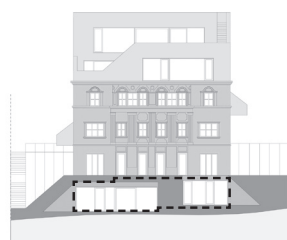
POHLED ZE ZAHRADY